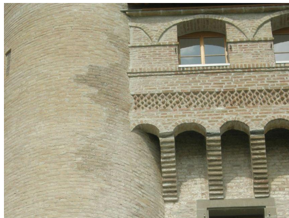
Assainissement des briques dégradées et conservation des briques encore saines