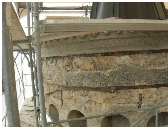
Détail cerclage du couronnement dégradé