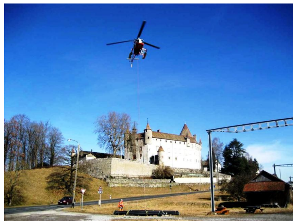
Héliportage des cadres