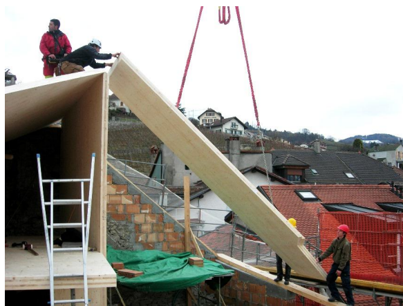
Montage de la nouvelle charpente