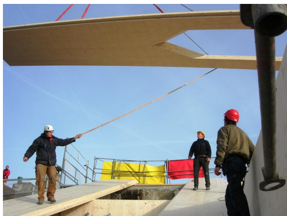
Montage de la nouvelle charpente