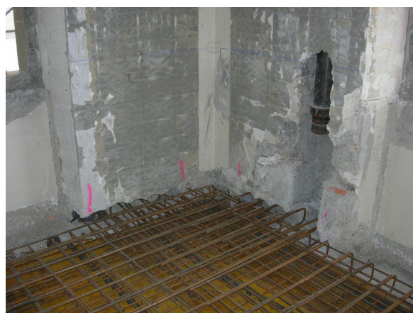
Ferrailage d'une nouvelle dalle