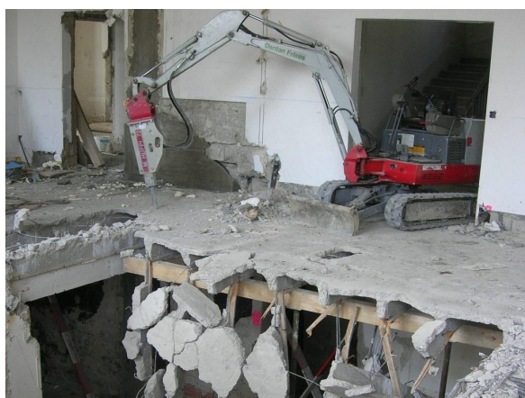
Démolition des dalles nervurées

Démolition des dalles nervurées par étapes et remplacement par dalles en béton armé. Renforcement global de la structure des façades porteuses. Création d'une cage d'escaliers avec ascenseur.