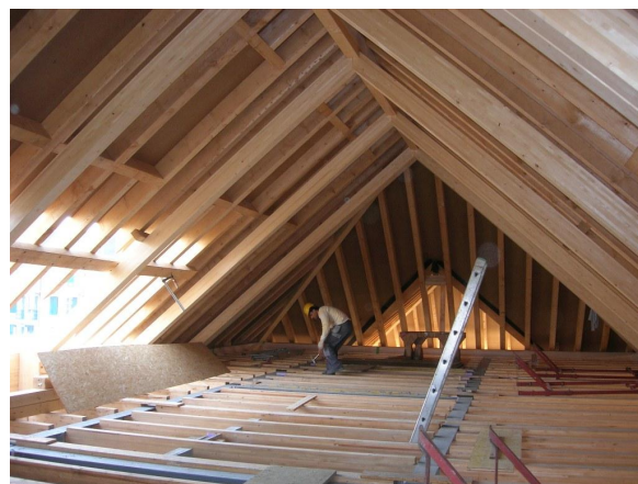
Montage de la charpente