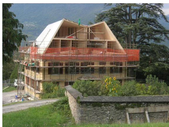
Squelette de la charpente