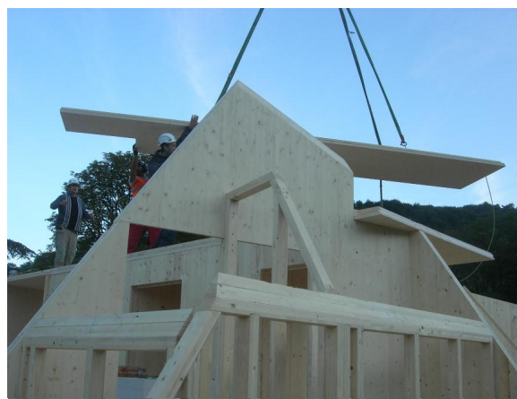
Montage de la charpente