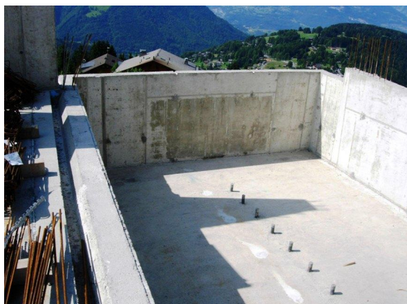
Piscine intérieur précontrainte