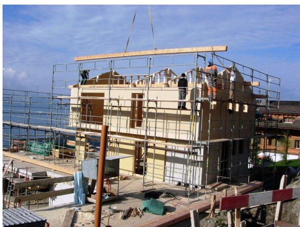
Montage de la charpente bois