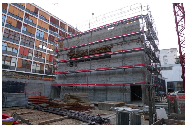
Tour régie en construction