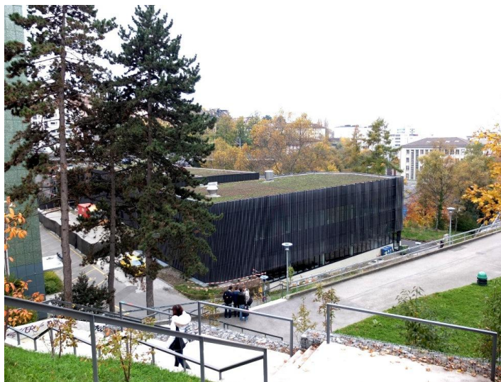
Vue depuis la route de Genève

Démolition du bâtiment central d'un complexe de trois bâtiments et reconstruction de 2 salles de théâtre en charpente métallique avec une tour de régies mitoyenne en béton armé.