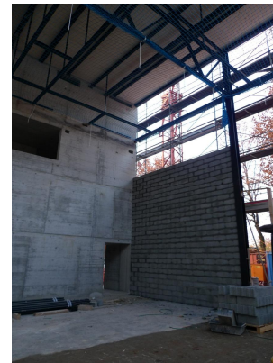
Fermeture façades en briques