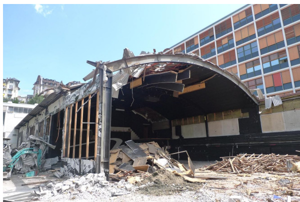
Démolition du bâtiment existant

Démolition du bâtiment central d'un complexe de trois bâtiments et reconstruction de 2 salles de théâtre en charpente métallique avec une tour de régies mitoyenne en béton armé.