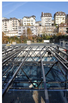
Pannes de toiture