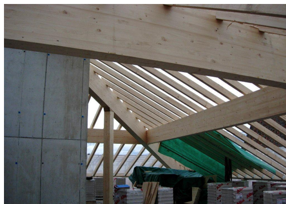
Montage de la charpente