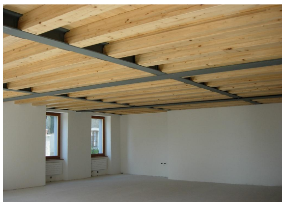
Structure mixte acier-bois, portée 12 x 12 mètres