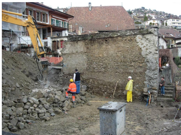
Terrassement au montabert.

Création d'un caveau en conservant les murs de pierres existants. Façades en béton "noir" teinté dans la masse. Isolation phonique intégrée à la structure.