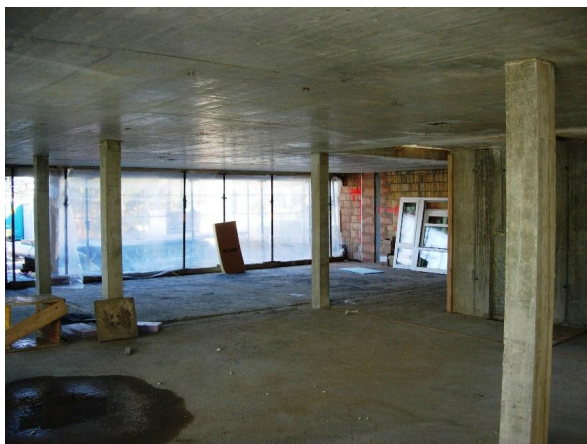
Structure : Piliers et dalles en béton armé