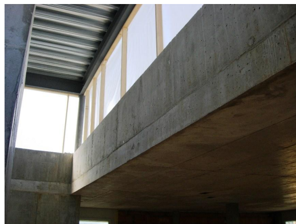
Puit de lumière sur cage d'escalier - ascenseur