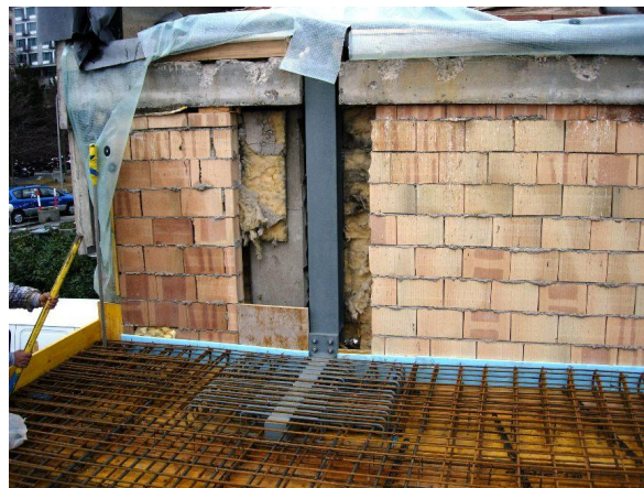
Report des charges sur le bâtiment existant