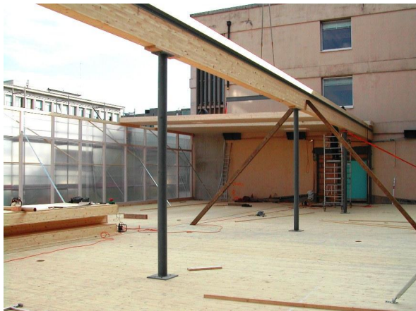
Montage de la toiture