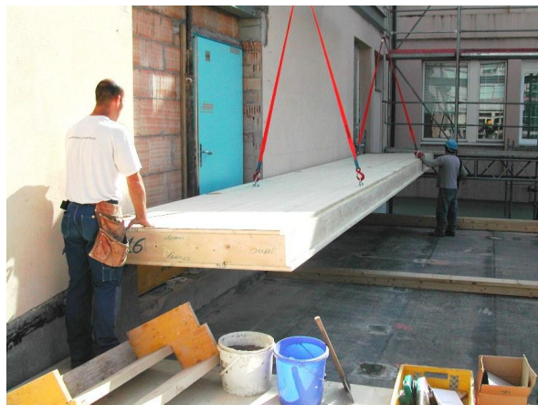
Pose d'un élément de plancher