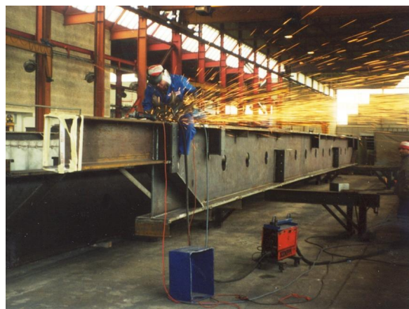
Fabrication des poutres principales en atelier