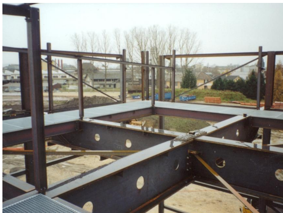
Assemblage des poutres principales