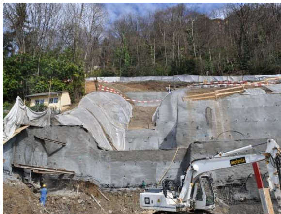
Parois clouées sur plusieurs niveaux + parois Berlinoise