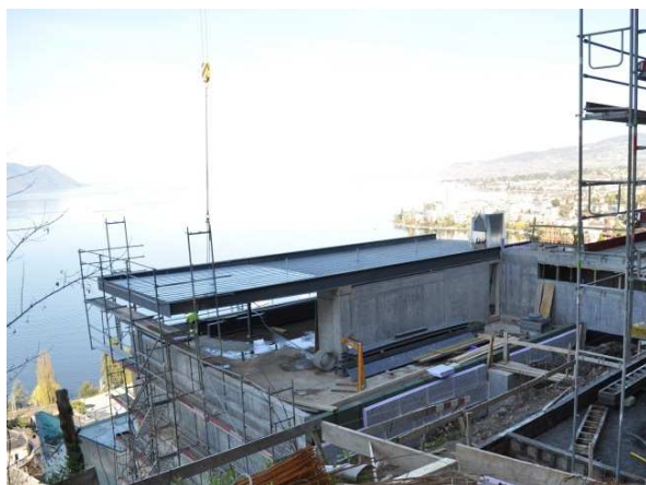
Toiture métallique en porte-à-faux