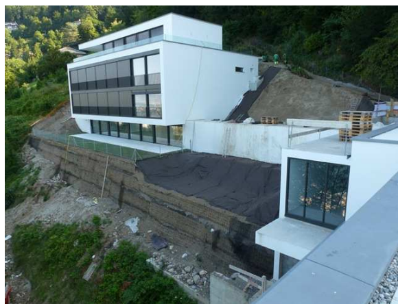
Exécution de talus en terre-armée devant le bât. C