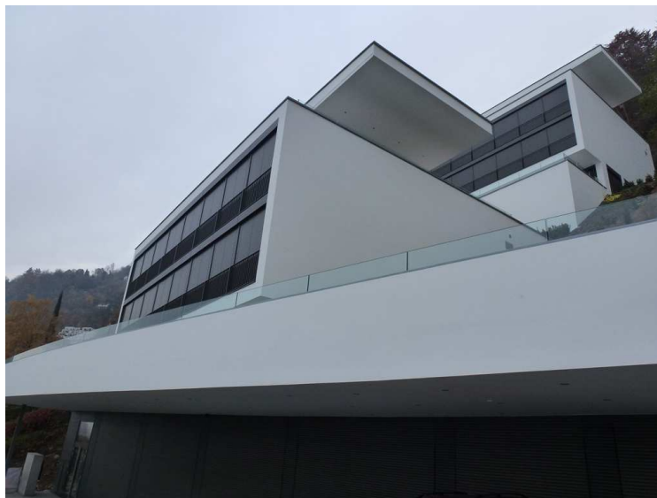
Vue du bâtiment A et B depuis les garages

Construction de trois bâtiments dans un terrain en forte pente qui a nécessité la construction de plusieurs parois clouées ainsi qu'une paroi Berlinoise. Installation de la grue avant le début des constructions, le bâtiment B a été construit autour de la grue. Bétonnage d'une cage d'ascenseur inclinée.