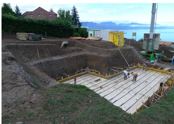
Terrassement / Radier sous-sol