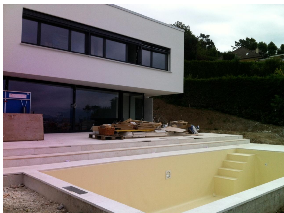
Terrasse / Piscine