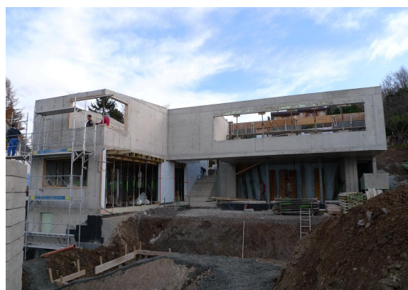
Gros œuvre terminé