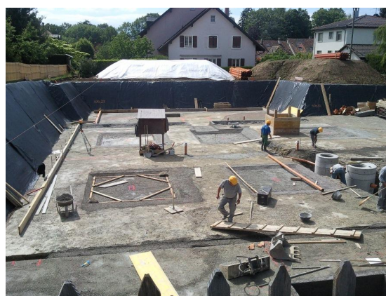
Terrassement / Surprofondeurs