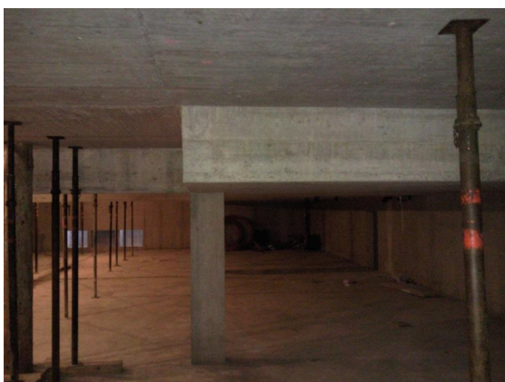
Sommiers du parking souterrain